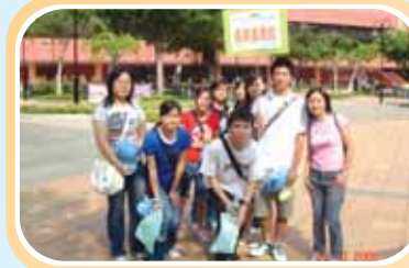
新健社步行籌款活動