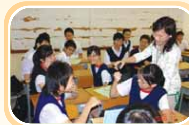
中五級性教育工作坊