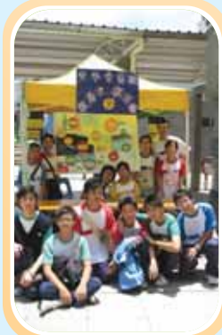
家居安全攤位活動