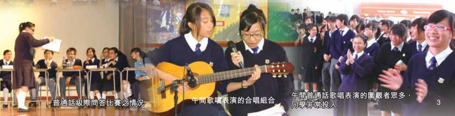
普通話級際問答比賽之情況