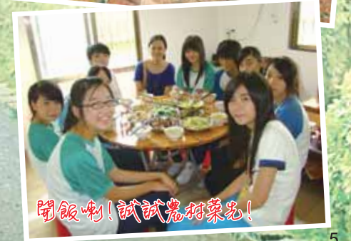
開飯喇！試試農家菜先！