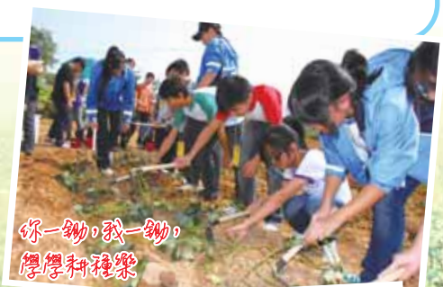
你一鋤，我一鋤， 學學耕種樂