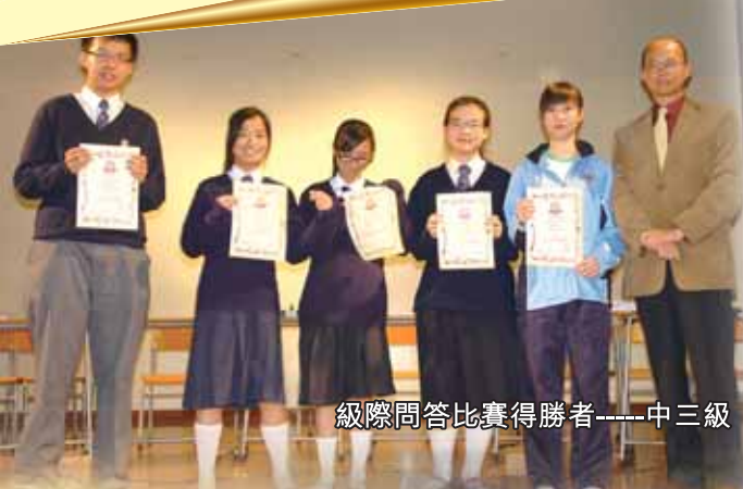
級際問答比賽得勝者——中三級

而週會內最精彩的環節，莫過於初中級的級際問答比賽，各參賽隊伍均派出各級的精英，務求在比賽中能取得勝利。是次比賽最終由中三級同學取得冠軍、中一級取得亞軍、中二級取得季軍，同學表現亦相當理想。